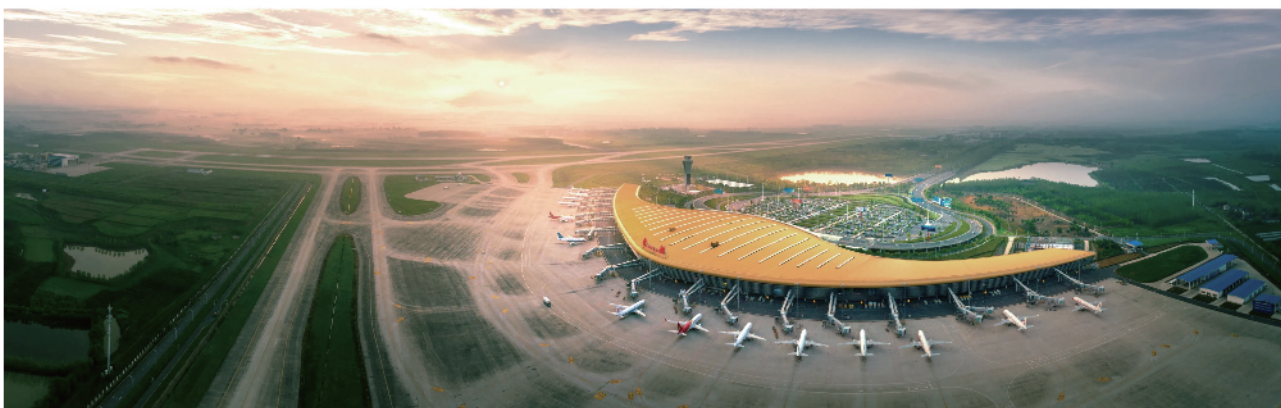
合肥新桥国际机场